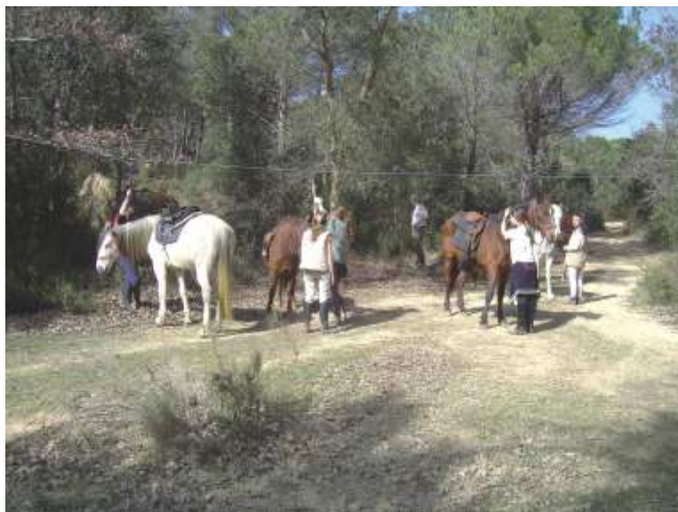
Els participants del curs fan pràctiques de nusos de seguretat i aprenen sistemes per lligar els cavalls en línia

Després de fer la prova dels cavalls en una pista preparada amb uns quants obstacles, que consistien a maniobrar amb el cavall sense forçar-lo, es van explicar tècniques per muntar el cavall